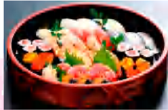
寿司盛り(上) ¥7,500 写真は3~4人前 ご予算に応じてお作りします