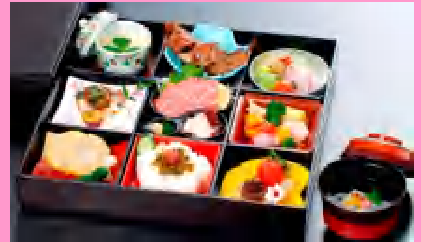
郷土青柳弁当 ¥2,100 プラス¥500で団子汁にもできます