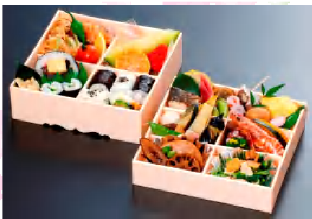
特選二段弁当 雅 ¥2,100