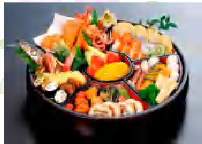
鉢盛り ¥7,000より 写真は3~4人前 ご予算に応じてお作りします