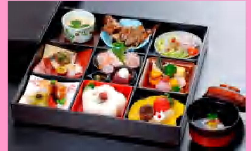
幕の内弁当 ¥1,600より ご予算に応じてお作りします