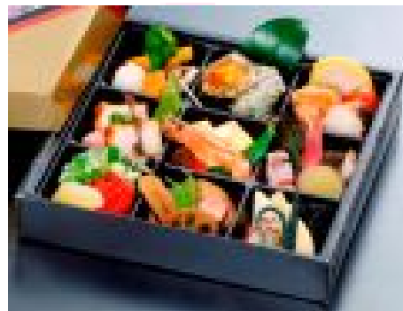
おつまみ重 ¥1,600 御飯はついていません